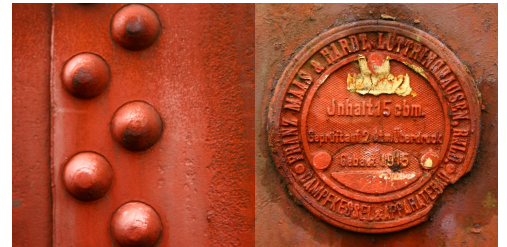
Zdjęcie do zadania "R"